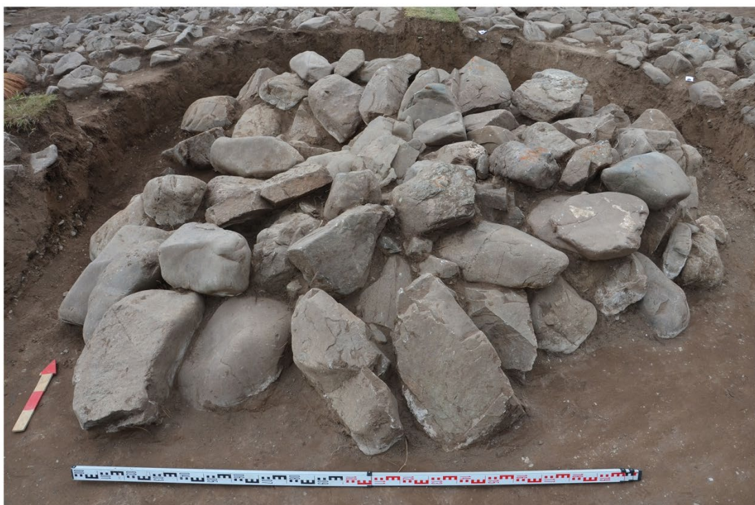
Рис. 8. Кок-Жар 1, курган 6. 1) Вид с запада, "циста". 2) Вид с севера, "циста". 2