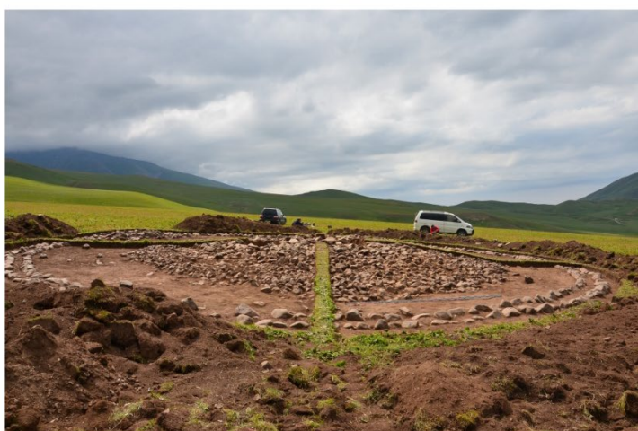
Рис. 6. Кок-Жар 1. 1) Расчищенный курган. Вид с северо-запада. 2) Вид с востока.