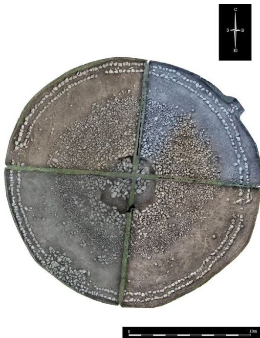
Рис. 5. Кок-Жар 1. Фотограмметрия расчищенного кургана б.